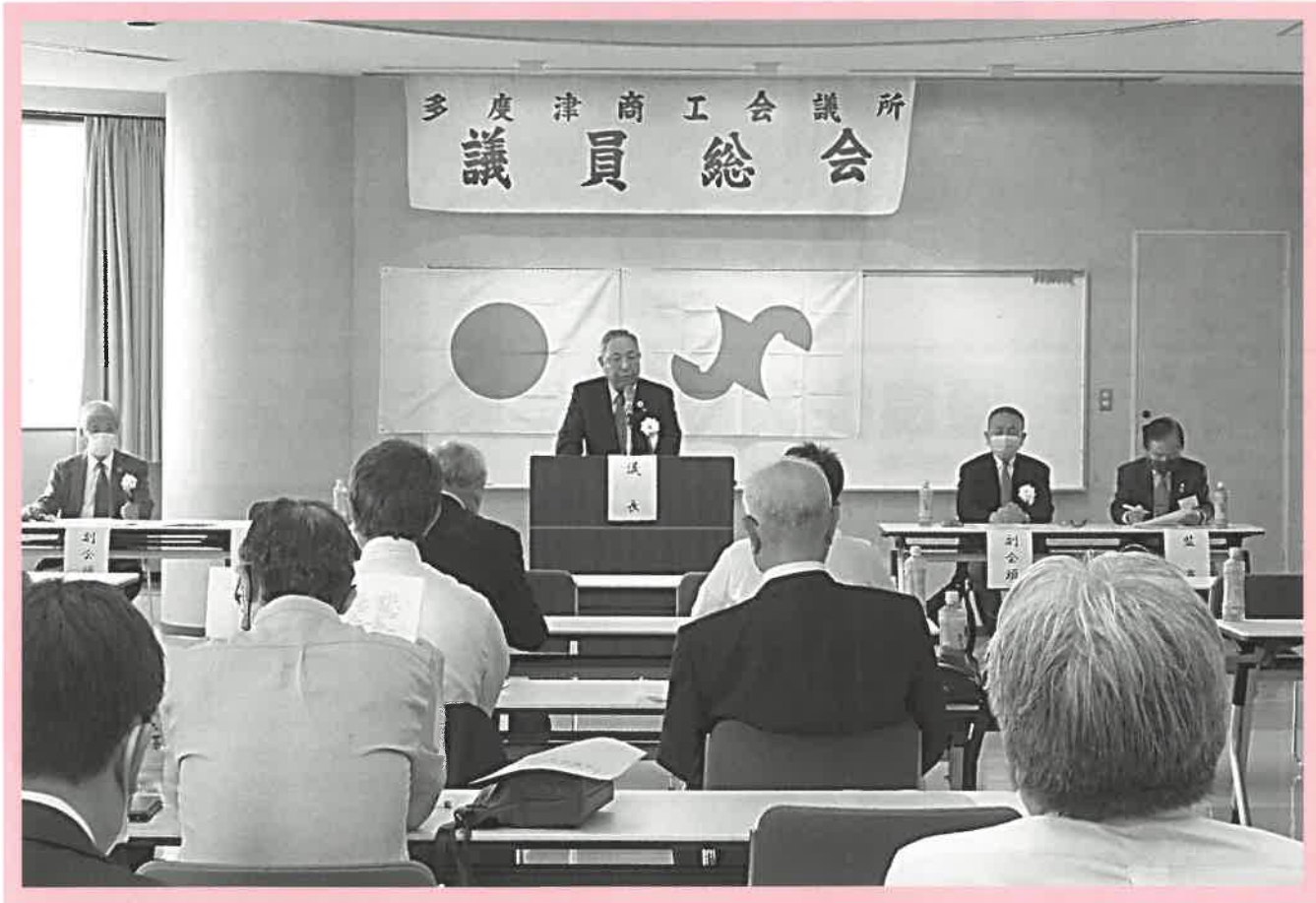
5月25日 通常議員総会の開催風景