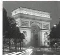
エトワール凱旋門

一年遅れて開催された東京2020も無事閉幕し、オリンピック旗は次の開催地パリへ引き継がれた。パリでの五輪開催は一世紀振り、パリのシンボルであるエッフェル塔やベルサイユ宮殿も会場となるようで、ハイテク都市東京とは違った大会になるものと期待される。