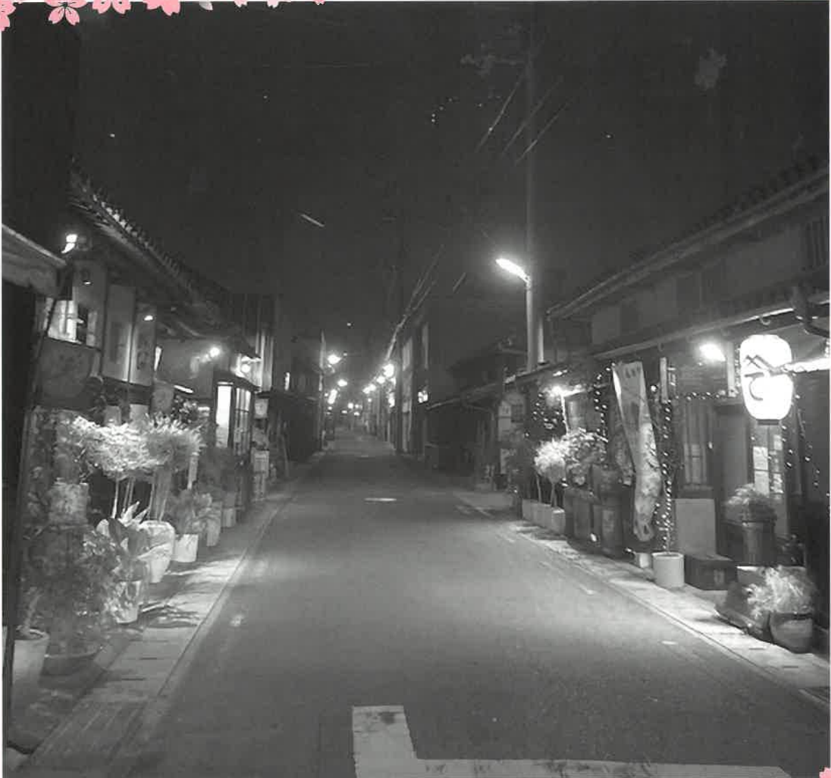
昭和の風情を残すレトロな町並(本通)