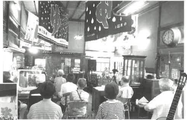
住吉実行委員長 挨拶