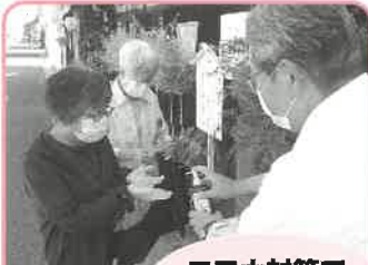
コロナ対策で 検温・消毒実施